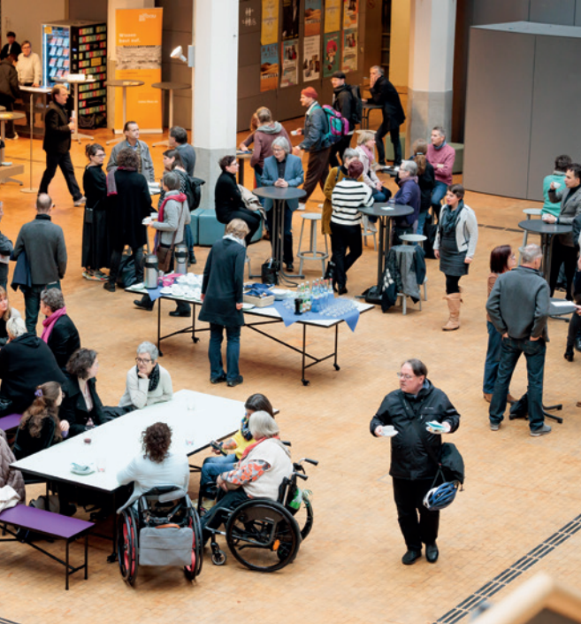
Auch für Begegnungen in den Pausen bot das ZKM | Zentrum für Kunst und Medien Karlsruhe am 4. März einen idealen Rahmen.