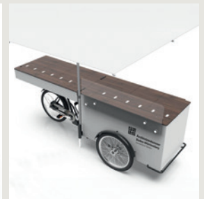
Design und Solution von paulkernst GmbH