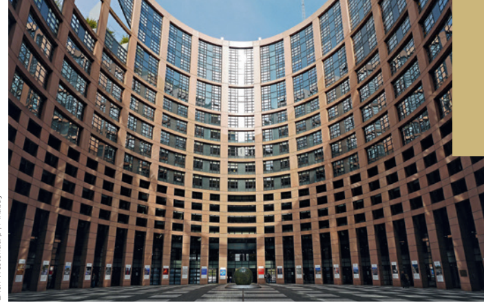
Europäisches Parlament in Straßburg | Entwurf: architecturestudio, Paris