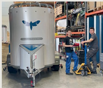
Der ArchitekturAnhänger befindet sich in der Fertigung.

Ab Fröhsommer begleiten der ArchitekturAnhänger und das BaukulturBike Veranstaltungen im Bezirk. Der Anhänger transportiert das BaukulturBike nicht nur über längere Strecken, sondern ist auch als Gastroeinheit, Infopoint oder Podium nutzbar.