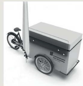
Das BaukulturBike wird noch mit Monitoren bestückt.